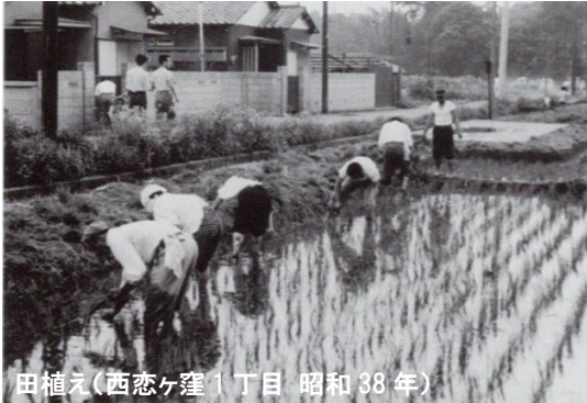
田植え（西恋ヶ窪1丁目 昭和38年）

恋ヶ窪村本村は、南北に入り込んだ谷に形成された集落で、中央を南北に道が横切り、その道の両側に家々が並んでいます。集落の両側では、ハケ上を畑として利用していました。1945（昭和20）年頃、ハケ下には24軒の家があり、東側、西側もほぼ同様に田、屋敷、畑が並んでいました。水田には恋ヶ窪村用水を利用し、田植えの時期には家族総出で農作業を行っていました。恋ヶ窪の水田は、昭和30年代になって上流に工場などが進出し、用水路に油や汚水が流入して水田が出来なくなり、JR武蔵野線が出来た1972（昭和48）年にはほとんどの水田が埋め立てられ、住宅が建つようになりました。