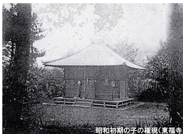
昭和初期の子の権現(東福寺)