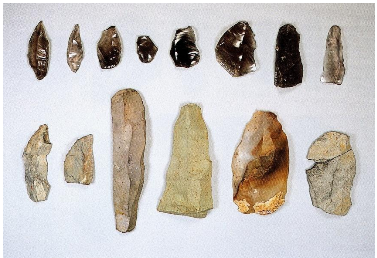
第Ⅲ文化層 出土石器

野川源流域の恋ヶ窪谷に面した台地上に位置する熊ノ郷遺跡もその一つで、約 2 万 4000 年前から 1 万 2000 年前の旧石器時代を中心とする遺跡です。この遺跡の発掘調査は発見の 3 年後の 1951 年（昭和 26 年）でした。その後 1982（昭和 57）年には市道拡張に伴う調査