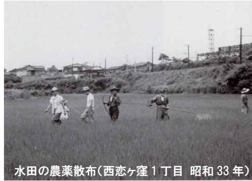
水田の農薬散布（西恋ヶ窪1丁目 昭和33年）