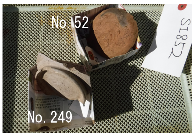
20. SI852 出土遺物（灰釉陶器碗と土師質土器坏）