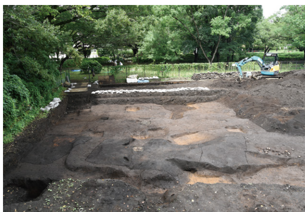
4. B区遺構検出状況（南から）