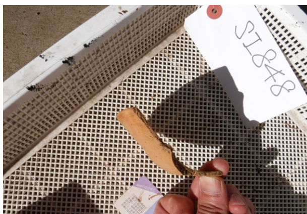
12. SI848 出土遺物（土師質土器杯）