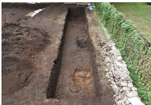
8. D区遺構検出状況（北東から）