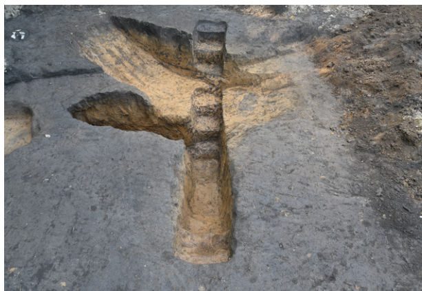
9. 防空壕完掘全景（南から）