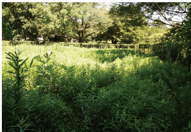
1. 調査地点 調査前全景（南から）