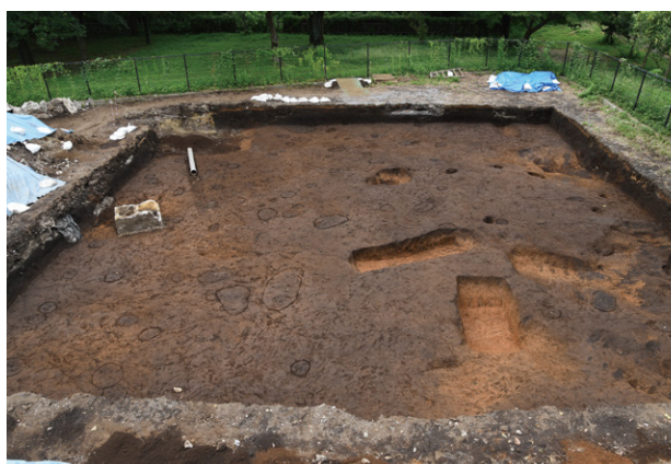
3. A区遺構検出状況（南から）