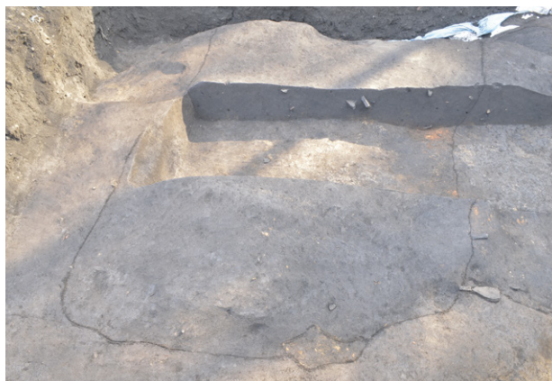
17. SI851 全景（北から）