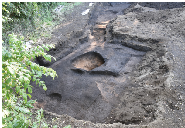
6. C区遺構検出状況（北東から）