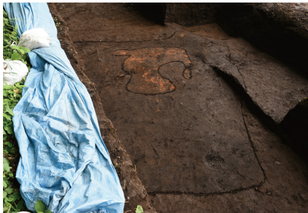
5. SI848 検出状況（南から）