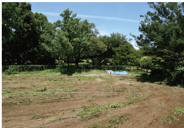
2. 調査区設定状況（南から）