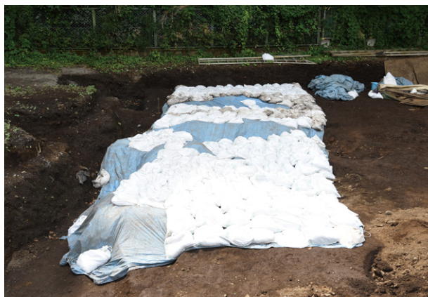
10. A区 SI848 ～ 851 埋戻し前養生状況（東から）