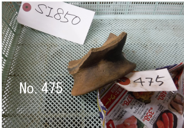
14. SI850 出土遺物（土師質土器高台付碗）