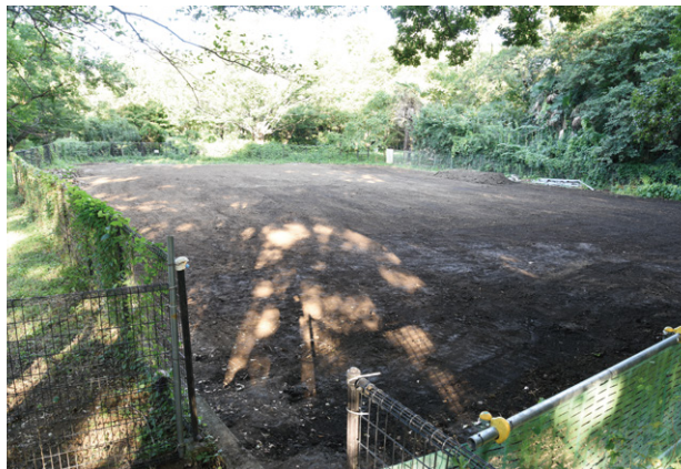
21. 調査完了全景（北西から）