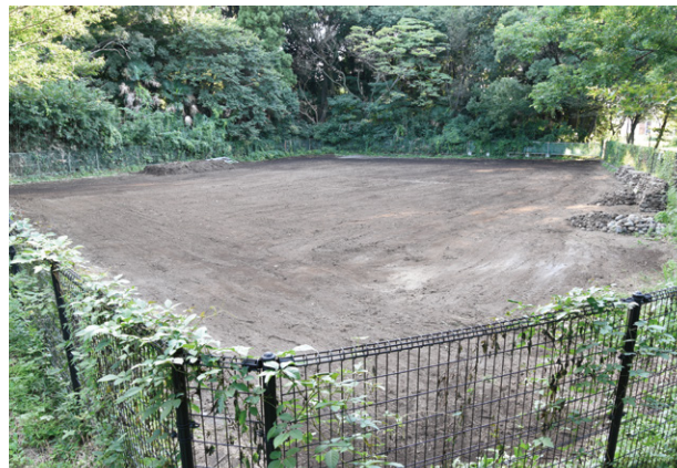
22. 調査完了全景（北東から）