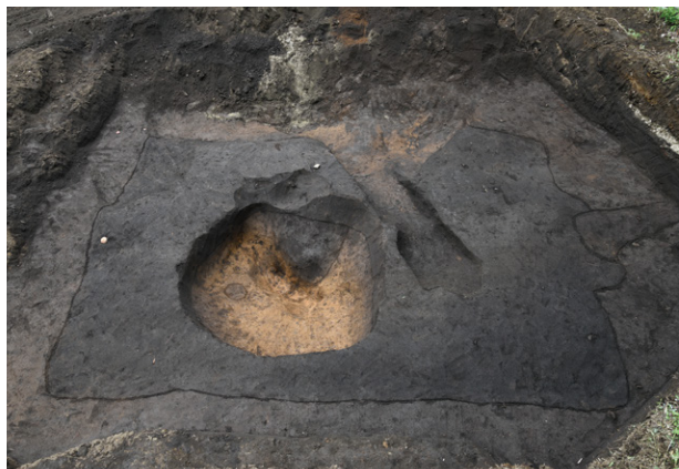
7. SI852 検出状況（南から）