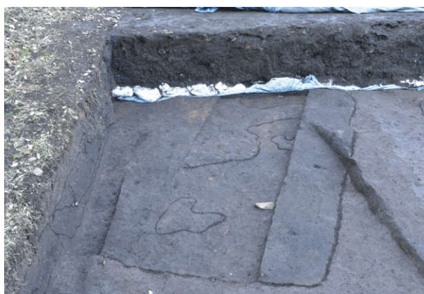
11. SI848 全景（南から）