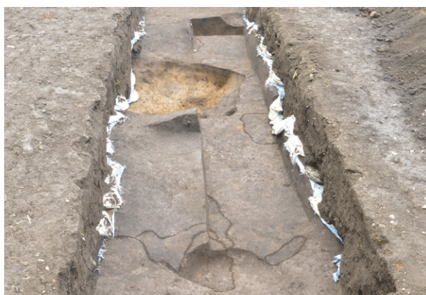
19. SI852 全景（東から）