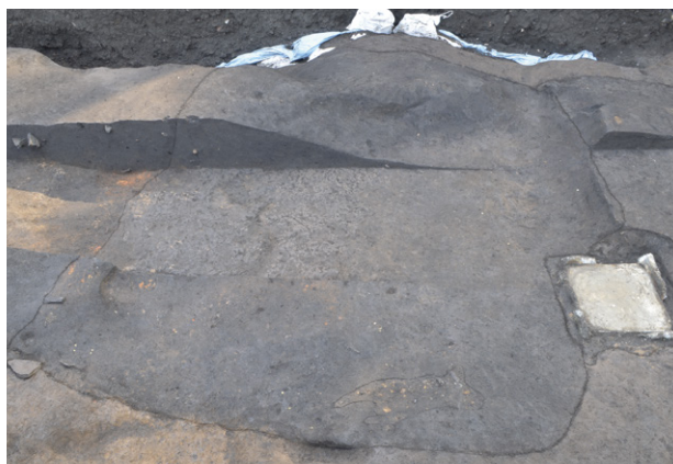
15. SI849 全景（北から）