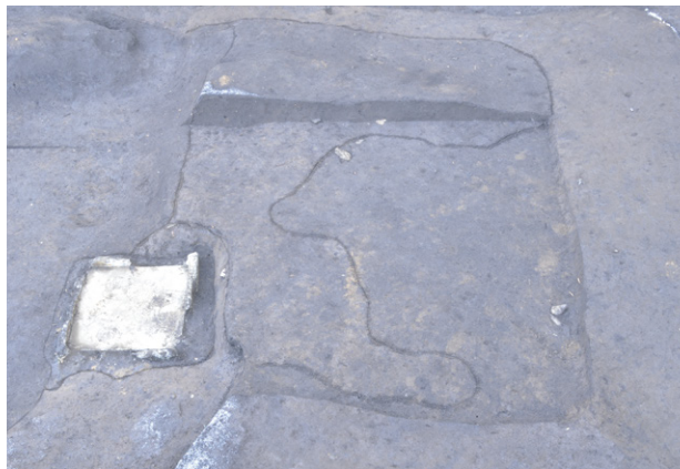
13. SI850 全景（北から）