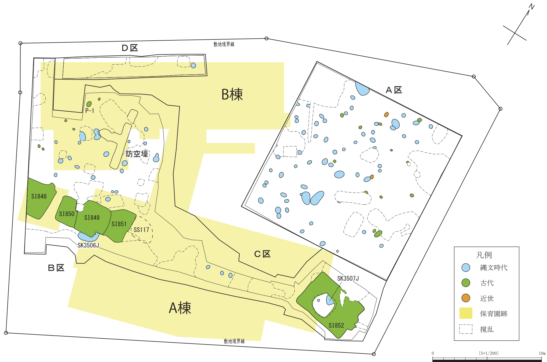
第2図 武蔵国分寺跡第780次調査 遺構全体図