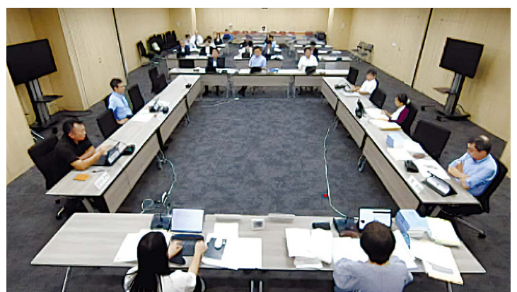
常任委員会 録画配信(イメージ)

●映像及び音声の著作権は、市が所有しています。著作権法上認められた場合を除き、市の許可なく無断で複製・転用することはできません。