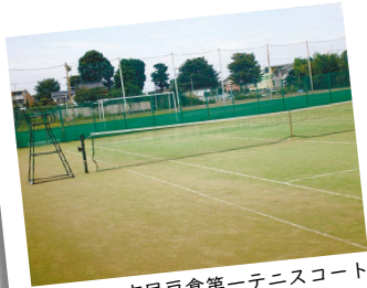
市民戸倉第一テニスコート

答 大規模な改正になるため、市としても周知は非常に重要だと考えている。4月1日号市報に掲載するほか、市ホ