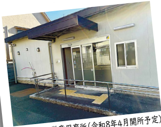
第四日吉町学童保育所(令和8年4月開所予定)

答 後期高齢者医療制度の被保険者に納入通知書などが届かない場合に公示送達を行う。直近5年間での実績はない。