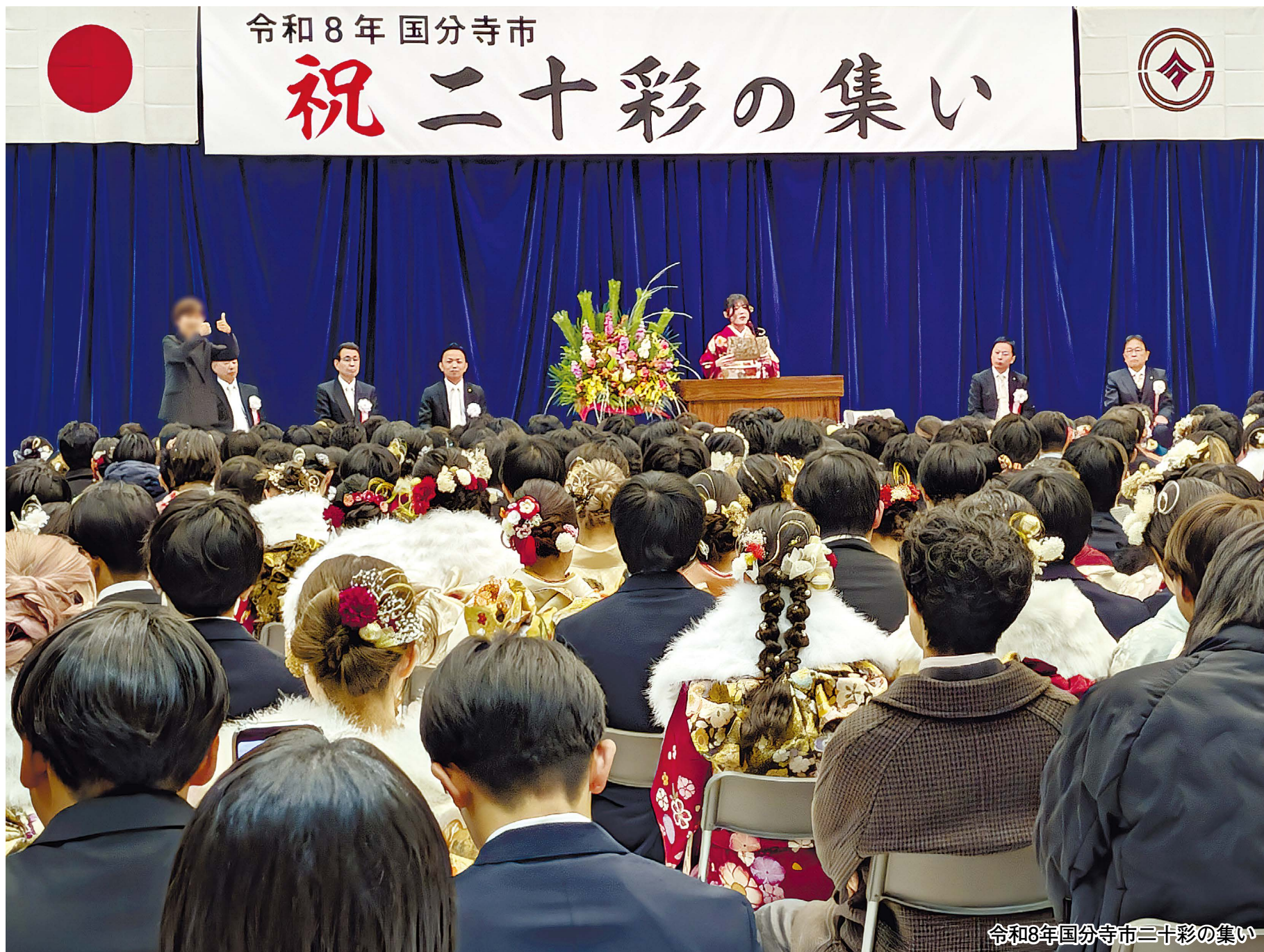
令和8年国分寺市二十彩の集い