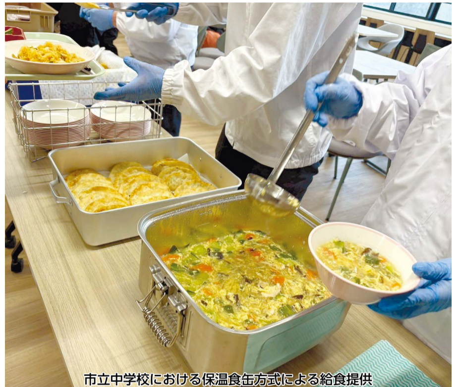
市立中学校における保温食缶方式による給食提供

中学校部活動地域連携・地域展開事業につきましては、子どもたちが豊かなスポーツ・文化芸術活動に取り組める環境を確保するとともに、教員の負担軽減を図るため、学校や地域関係団体と連携し取組を進めてまいります。あわせて、専門的な指導を行う部活動指導員等の配置を拡充するとともに、休日の部活動については、新たな種目の地域展開にも取り組んでまいります。