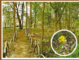
若返った林とキンラン

木々には若葉が萌え、 林床にはキンラン・ ギンラン・ヒトリシズカ などの雑木林の花も 姿を見せます