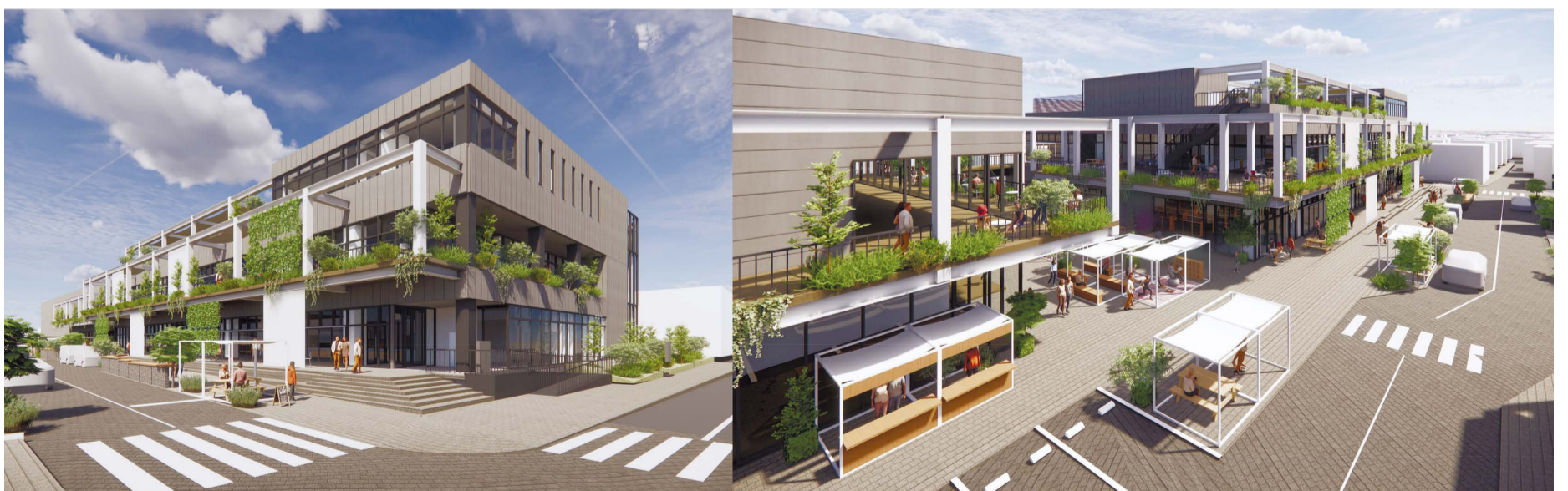
旧庁舎用地に整備予定の民間施設と複合公共施設(イメージ図)

議員各位をはじめ市民の皆様におかれましては、何とぞご理解とご協力を賜りますようお願い申し上げます。令和8年度の施政方針といたします。