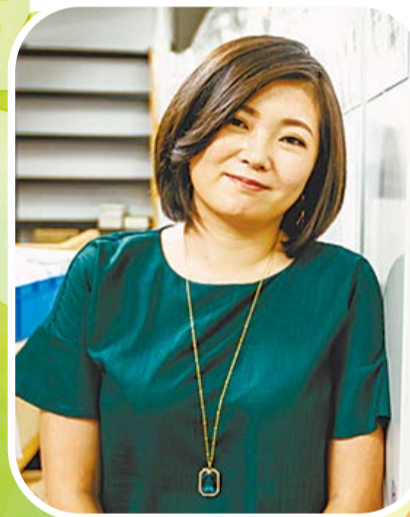
講師 吉田恵里香さん (脚本家・小説家)

連続テレビ小説「虎に翼」をはじめ多数の脚本を執筆。ドラマ「恋せぬふたり」で第40回向田邦子賞・第77回文化庁芸術祭優秀賞を、アニメ「ぼっち・ざ・ろっく!」で第9回ATA最優秀脚色賞を受賞