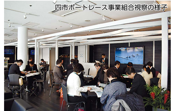
四市ボートレース事業組合視察の様子