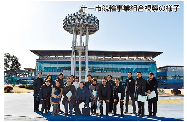
十一市競輪事業組合視察の様子

公営競技の健全な運営と収益金の構成市への還元について理解を深めるとともに、今後の課題や展望についても意見交換を行いました。今回の視察で得た知見を議会での活動に活かしてまいります。